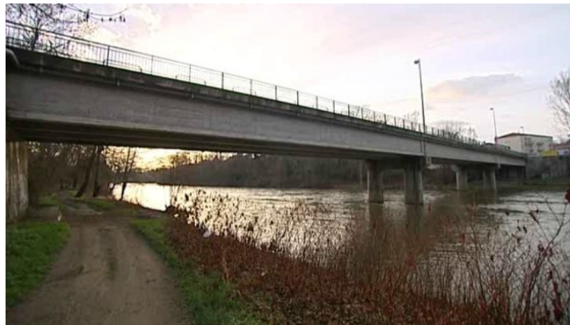
Chaque jour, près de 15 000 véhicules empruntent l'unique pont de Cournon. Les axes routiers sont régulièrement engorgés. Pour les communes de Cournon et Pérignat-sur-Allier, il est urgent d'agir.

C'est une bonne nouvelle pour le collectif Ensemble pour Un Nouveau Pont sur l'Allier (ENPA). L'association a enfin reçu l'échéancier du Conseil Général du Puy-de-Dôme concernant le projet de contournement de Cournon.